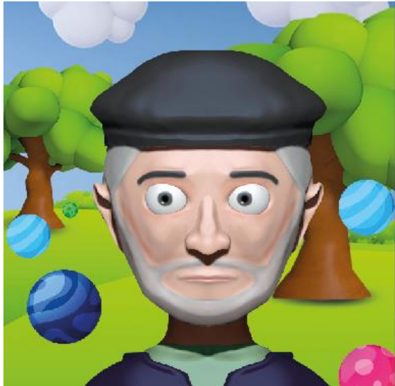
Figura 3. Maquetación

La figura 3 muestra la maquetación del personaje y el relato dentro de una página del libro impreso. La figura 4 muestra la aplicación de la RA en Spark Ar en los modelos 3d, mientras que en la figura5 se observa el resultado a través del filtro de Instagram mediante la cámara del dispositivo.