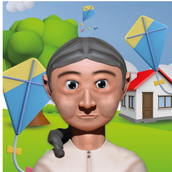
Figura 2. Modelado 3D de personajes

Nota. Modelos realizados en base a fotografías de los adultos mayores y abstracción de características.