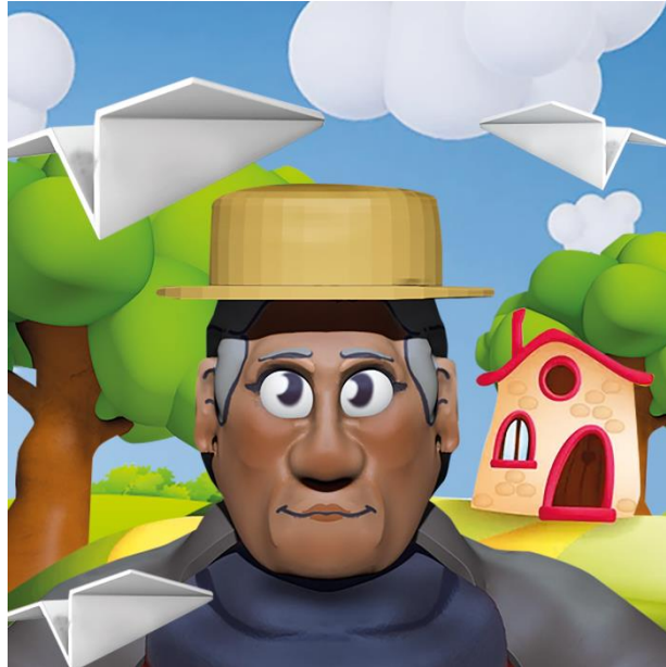
Figura 1. Ilustraciones de personajes

Nota. Gráficos realizados basados en las sesiones fotografías de los adultos mayores.