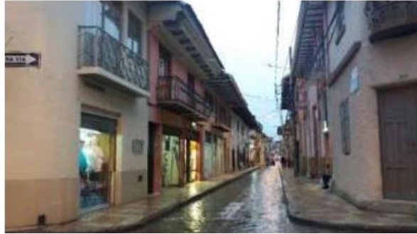
Ilustración 5. Calle de los zapatos

Ubicación: en la cabecera cantonal del centro histórico, en las coordenadas 2°53'29.1"S y 78°46'45.0"W, entre las calles Dávila Chica, Gran Colombia y Luis Cordero