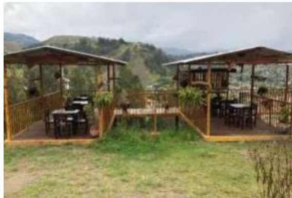
Ilustración 16. Mirador María Juana

Ubicación: Se encuentra en la cabecera cantonal de Gualaceo, en el sector de Toptelomas.