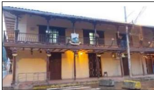
Ilustración 2. Casa del Municipio

Ubicación: se encuentra en la cabecera cantonal urbana del centro histórico, en las coordenadas 2°53'23.7"S y 78°46'46.6"W, entre las calles Gran Colombia y Av. Tres de noviembre.