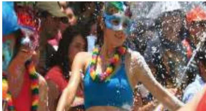
Ilustración 12. Carnaval en el río de Gualaceo

Ubicación: La ubicación se refiere a un desfile característico en el cual participa toda la comunidad, tradicionalmente llevado a cabo los domingos por las principales calles del cantón, culminando en las orillas del río Santa Bárbara, en las coordenadas 2°53'38.1"S y 78°46'30.5"W.