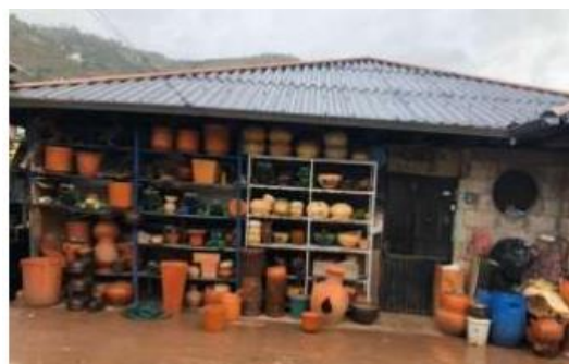
Ilustración 15. Cerámica Bueno

Ubicación: se encuentra en el sector Llampasay, en la vía GualaceoCuenca, en las coordenadas 2° 52' 44.591"S y 78° 45' 54.284" W. Al sitio se llega en 5 minutos desde el centro cantonal de Gualaceo