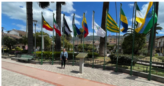
Ilustración 34. Calle de los Zapatos