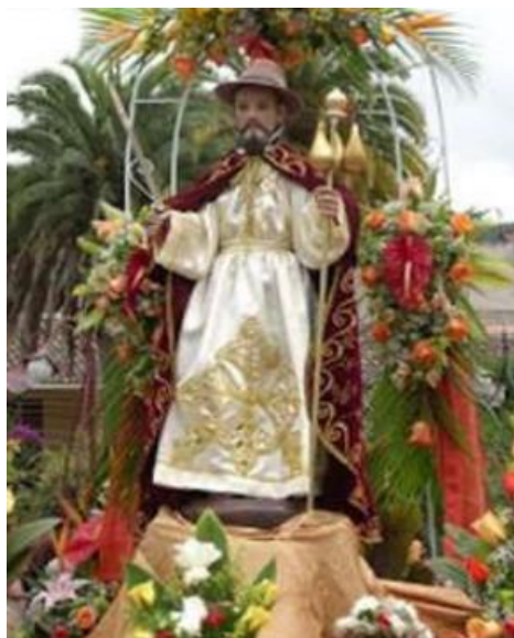
Ilustración 14. Fiesta religiosa en Honor al Patrón Santiago de Gualaceo

Esta tradición, que se ha llevado a cabo en el cantón durante muchas décadas, hoy en día constituye una parte significativa del patrimonio cultural intangible de la ciudad de Gualaceo.