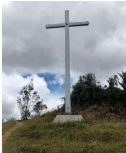
Ilustración 22. El calvario

Actividades: Eucaristías durante las fiestas religiosas y convivencias, fotografía, caminatas, camping y observación de flora y fauna.