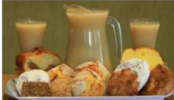
Ilustración 17. El Rosero

Características: El rosero es una bebida tradicional de Gualaceo, presente en toda celebración, fiesta u ocasión importante. Esta bebida típica ha sido preservada por los gualaceños a lo largo del tiempo. En la Av. Jaime Roldós, se puede encontrar una gran variedad de locales que ofrecen el típico rosero, acompañado de dulces tradicionales de Gualaceo como panes o bocaditos. Los ingredientes para la elaboración de esta bebida incluyen harina de maíz y varias frutas tropicales como manzana, pera, piña, naranja y limón, además de esencias de vainilla, canela, azúcar, agua de olores y almíbar. Cada año, los artesanos que fabrican esta bebida y los dulces gualaceños se reúnen en la plaza central de Gualaceo para ofrecer sus productos durante la fiesta del rosero y los dulces.