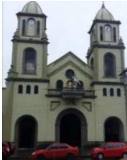
Ilustración 4. Iglesia Santiago de Gualaceo

Ubicación: se encuentra en la cabecera cantonal urbana del centro histórico, en las coordenadas 2°53'23.0"S y 78°46'44.2"W, entre las calles Dávila Chica y Av. Tres de noviembre.