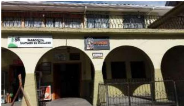
Ilustración 10. Museo de la Vicaria

los primeros siglos de evangelización de Gualaceo. Además, se muestran tesoros patrimoniales conservados por la iglesia a lo largo de los siglos, especialmente aquellos de la antigua iglesia matriz que estaban almacenados en el convento parroquial. El museo también dispone de una cocina donde los visitantes pueden degustar la bebida tradicional conocida como rosero, y un traspatio con una jardinera para disfrutar.