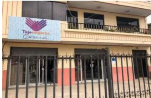
Ilustración 8. Teje mujeres

Ubicación: se encuentra en la Av. 3 de noviembre y Eugenio Espejo, entre las coordenadas 2° 53' 24.742" S y 78° 46' 29.42" W; localizada a pocos metros del puente del río Santa Bárbara.