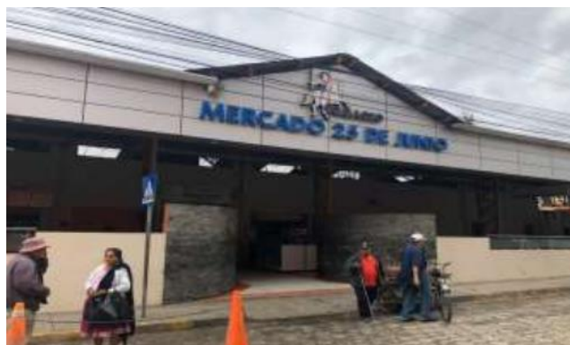
Ilustración 6. Mercado 25 de Junio

Ubicación: se encuentra en el centro histórico de Gualaceo, entre las calles Cuenca y Manuel Moreno; a pocos pasos del sitio podemos encontrar el parque central de la ciudad