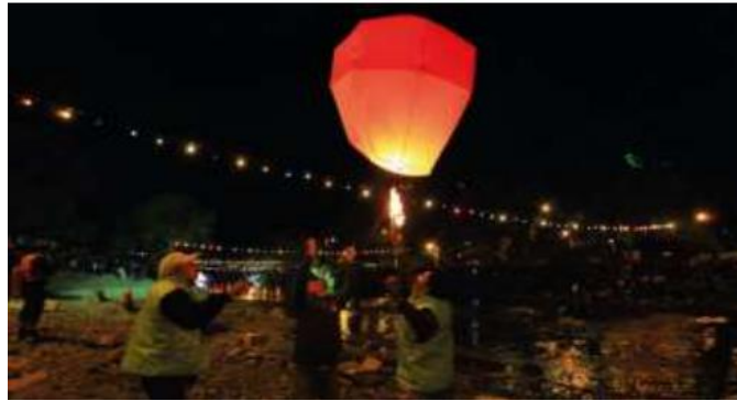
Ilustración 13. Fiestas de Cantonización

Actividades: recreativas, fotografía, participación en talleres, degustación de platos típicos y compra de artesanías.