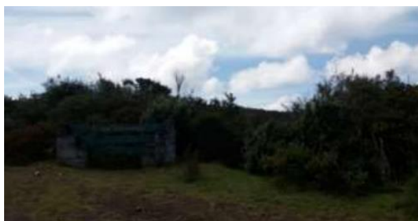
Ilustración 19. Bosque Aguarongo

Actividades: Interpretación ambiental, recorridos guiados, degustación de platos tradicionales, exhibición de piezas originales, fotografía, compra de artesanías, observación de flora y fauna, picnic, caminatas, camping y actividades recreativas.