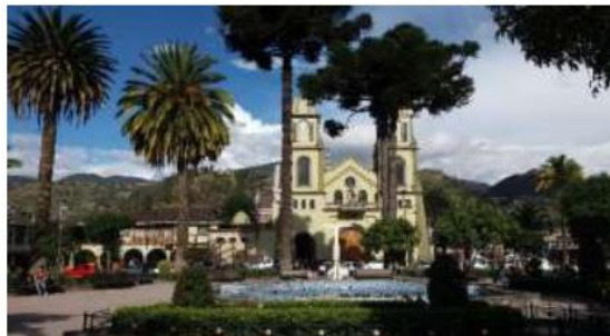
Ilustración 3. Parque central

Ubicación: se encuentra en la cabecera cantonal urbana del centro histórico en las coordenadas 2°53'23.3"S y 78°46'44.9"W, entre las calles Vía a Jadán, Gran Colombia, Av. Tres de noviembre y Dávila Chica.