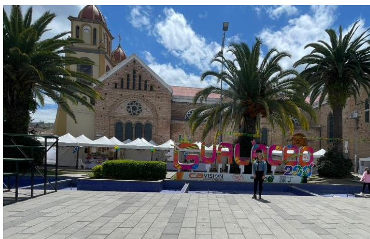
Ilustración 35. Plaza Cívica