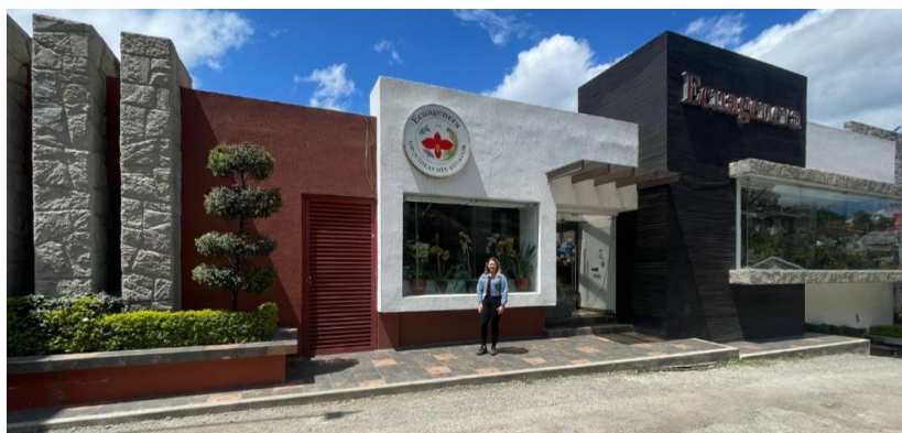
Ilustración 36. Ecuagenera