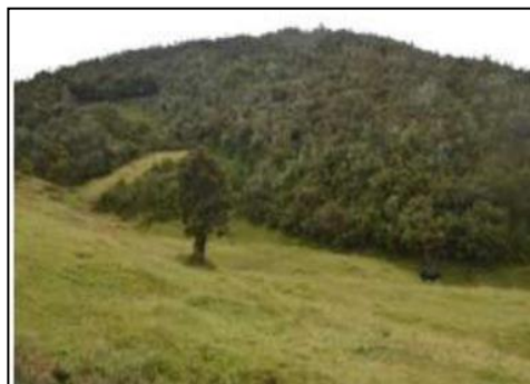
Ilustración 21. Cerro Campanahurco

Actividades: Fotografía, caminata, camping y observación de flora y fauna.