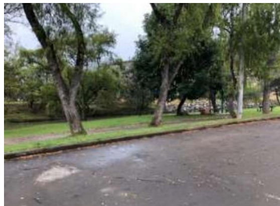
Ilustración 11. Riberas del río Santa Bárbara

Ubicación: se encuentra entre las coordenadas 2° 53' 43.188"S y 78° 46' 30.19"W, a pocos metros de la Av. Jaime Roldós.