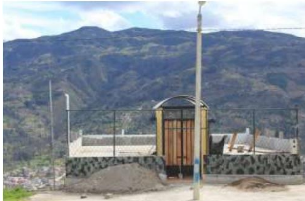
Ilustración 18. El mirador de Capzha

Ubicación: Se encuentra en la parroquia Luis Cordero Vega, en la comunidad de Capzha, con coordenadas 2°53'44.5"S y 78°42'08.1"W. Está a 27 minutos en vehículo desde la cabecera cantonal urbana de Gualaceo.