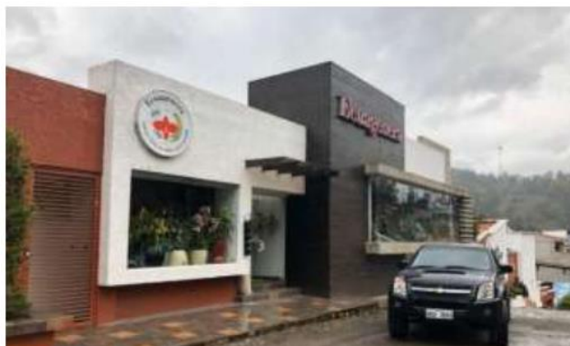
Ilustración 7. Orquideario Ecuagenera

Ubicación: se encuentra en el sector de Llampasay, km2, vía a Gualaceo, en las coordenadas 2° 52' 35.699"S y 78° 45' 50.659"W.