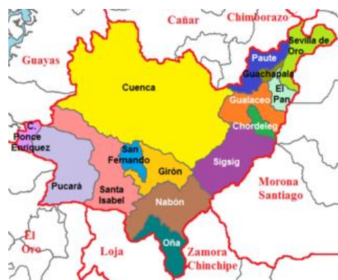
Ilustración 1. Ubicación geográfica Cantón Gualaceo

El cantón Gualaceo se encuentra en la zona nororiental de la provincia del Azuay, limitando al norte con los cantones Paute y Guachapala, al sur con Chordeleg y Sigsig, al este con El Pan, Sevilla de Oro y General Leónidas Plaza Gutiérrez de Morona Santiago, y al oeste con Cuenca. Sus coordenadas geográficas son 78°48'00" de longitud occidental y 2°54'00" de latitud sur, con una altitud de 2.370 metros sobre el nivel del mar. Gualaceo tiene una extensión de 346,5 km 2 , representando aproximadamente el 4,3% del área total de la provincia. La población estimada es de 47.000 habitantes. La ciudad principal está situada a 2.230 metros sobre el nivel del mar y tiene un clima subhúmedo templado, con temperaturas entre 12°C y 20°C y una precipitación anual de 500 a 1000 milímetros (Yanza, 2016).