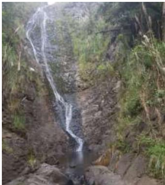
Ilustración 23. Cascada de Tasqui

Actividades: Pesca artesanal con caña, picnic, observación de flora y fauna, caminatas y camping.