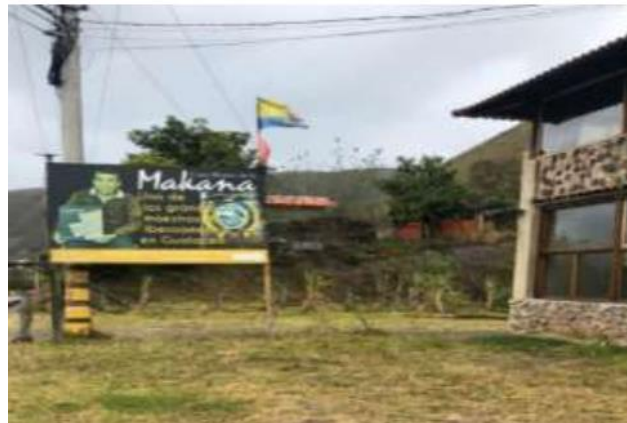
Ilustración 9. Museo casa de la makana