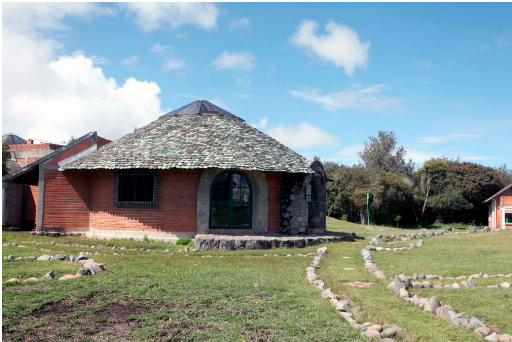
Imagen N° 14