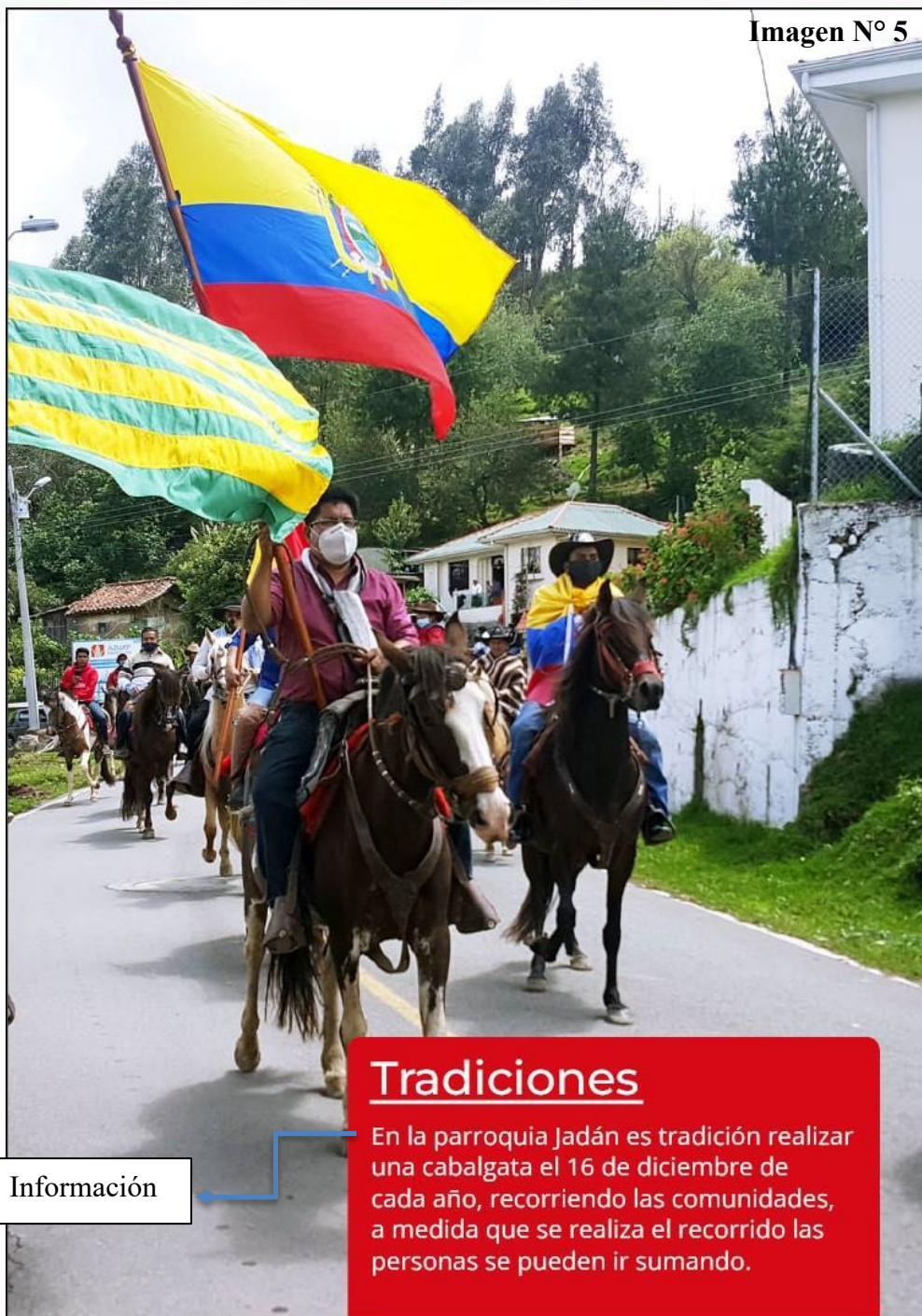
Imagen N° 5