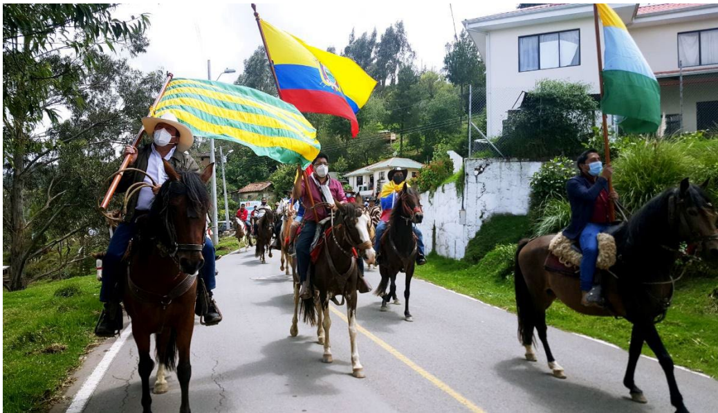
Imagen N° 10