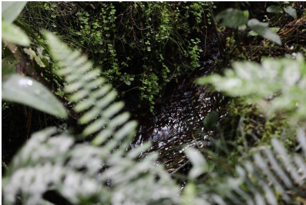
Imagen N° 12