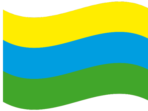
Figura N 2 Bandera de