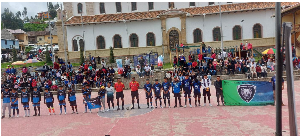
Imagen N° 9