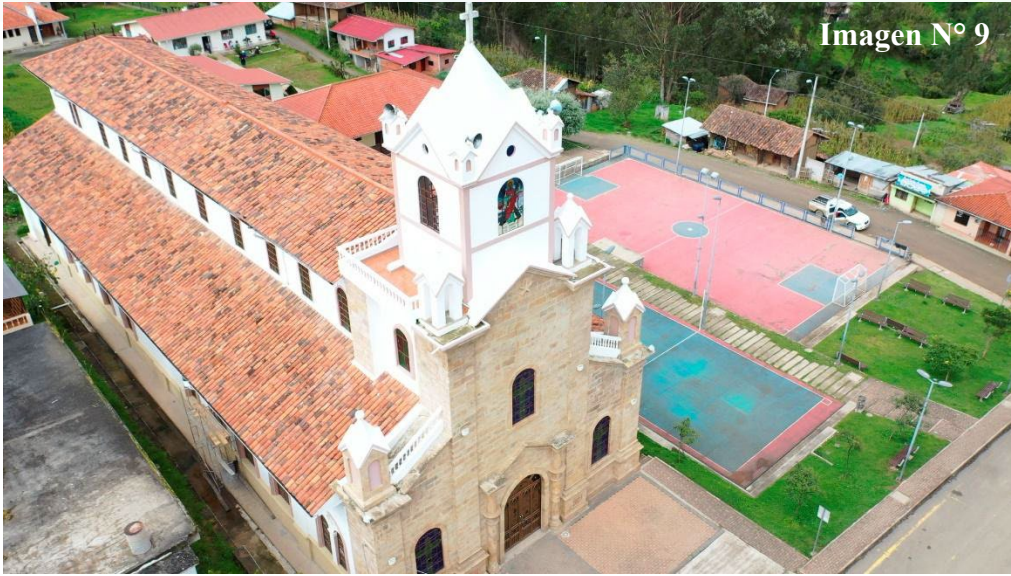
Imagen N° 9