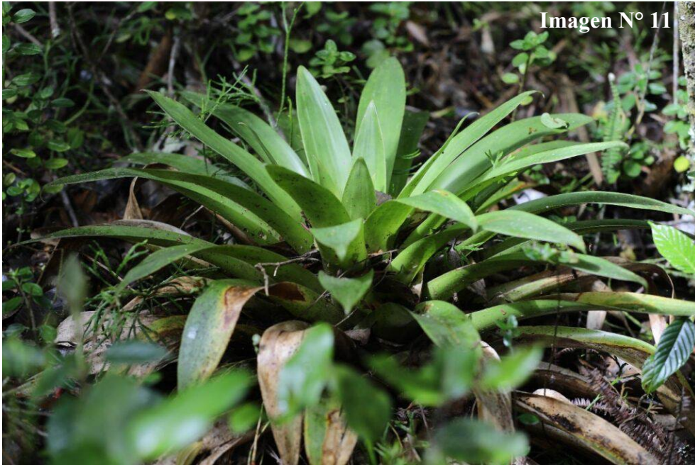
Imagen N° 11