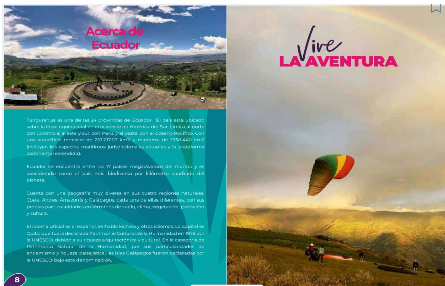
Imagen N° 2