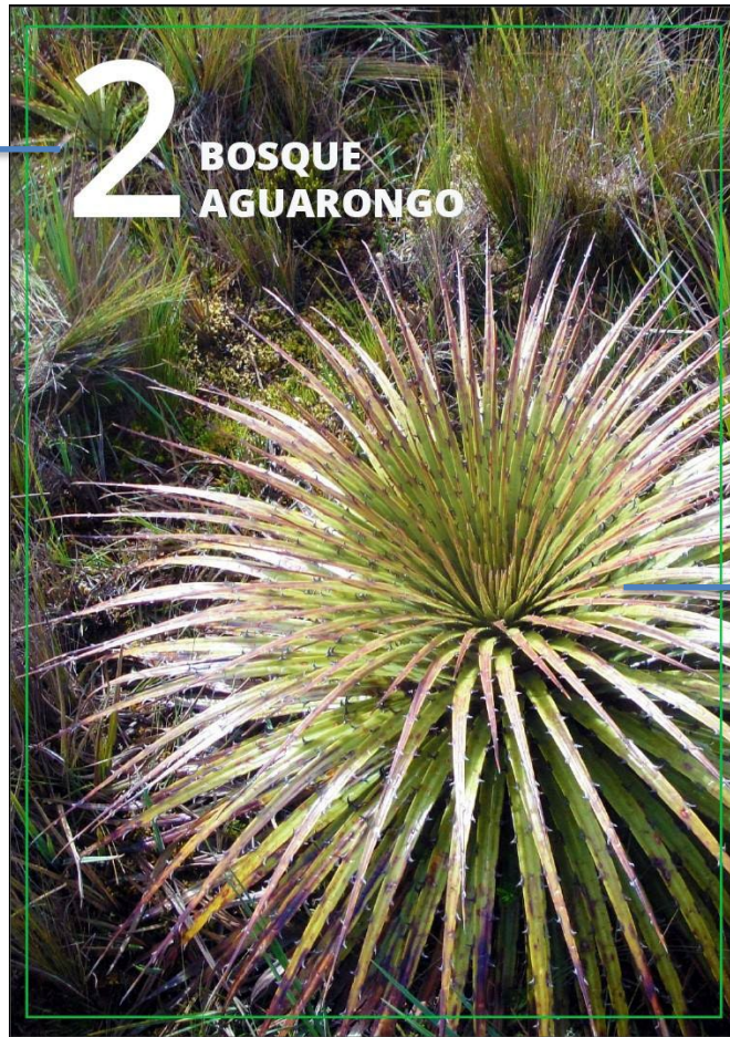
Imagen N° 4