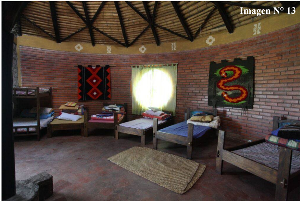
Imagen N° 13