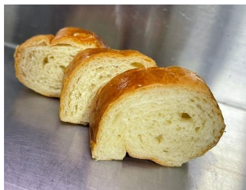
Fig. 4: Pan A.

Se dimensiona el “Sabor en general” y si bien no existe una diferencia significativa entre la “A” y “C”, al revisar la puntuación media la muestra del 3% con harina de insecto tiene mejor acogida, en la sección cualitativa de la encuesta, el panel evaluador no logra determinar el ingrediente añadido (harina de catzo) sin embargo un 42% de los participantes sugiere que se trata de semilla de chía, sésamo o anís. El “amargor” es marcado como superior en los panes “A” y “B”.