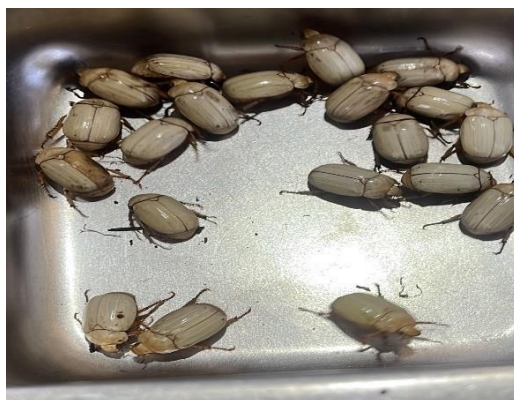
Fig. 1: Catzos blancos vivos.

<10 \pm 19.9\% UFC/g de E Coli, <10 \pm 19.9\% UFC/g de levaduras y <10 \pm 14.3\% UFC/g de mohos, encontrándose estos tres últimos resultados dentro del rango permitido por la norma la norma INEN 1334-2 Tercera revisión 2016 donde se señala los nutrientes obligatorios para