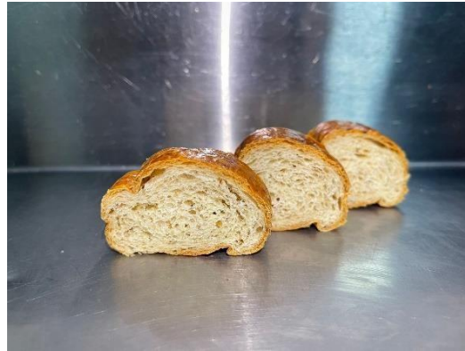
Fig. 3: Pan C.

Se dimensiona el “Sabor en general” y si bien no existe una diferencia significativa entre la “A” y “C”, al revisar la puntuación media la muestra del 3% con harina de insecto tiene mejor acogida, en la sección cualitativa de la encuesta, el panel evaluador no logra determinar el ingrediente añadido (harina de catzo) sin embargo un 42% de los participantes sugiere que se trata de semilla de chía, sésamo o anís. El “amargor” es marcado como superior en los panes “A” y “B”.