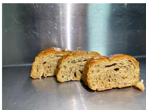
Fig. 2: Pan D.

A pesar de que la coloración varía de acuerdo con la cantidad de harina de trigo reemplazada, solamente el “Pan D” presenta una calificación significativamente menor a la de las demás muestras en cuanto a la “apariencia”